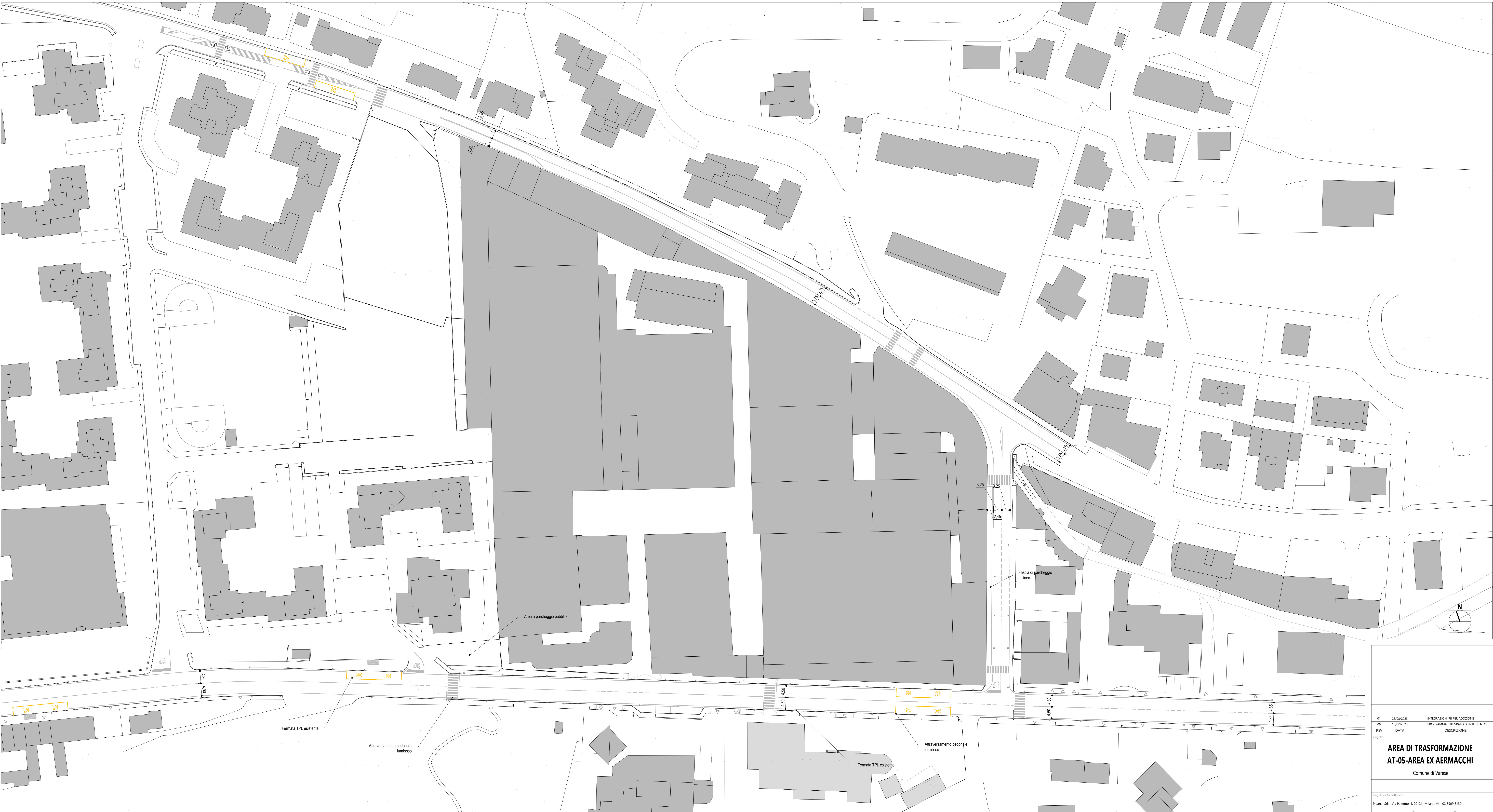
TRATTO C - Via Sanvito (da via Monguelfo a negozio Maxizoo), via Castoldi e via Crispi